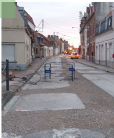
CADRE DE VIE