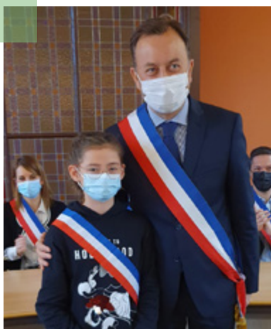
ÉDUCATION ET JEUNESSE