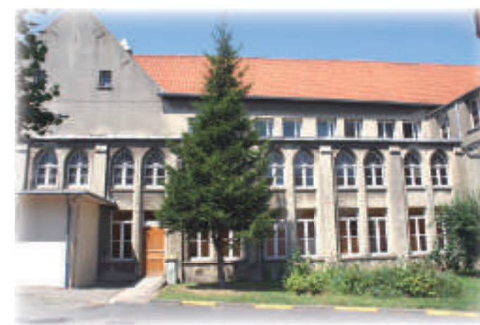
Le C.O.T. Anne Frank

Rendez-vous sous le porche Le samedi et le dimanche : Visites à 14h, 15h, 16h et 17h