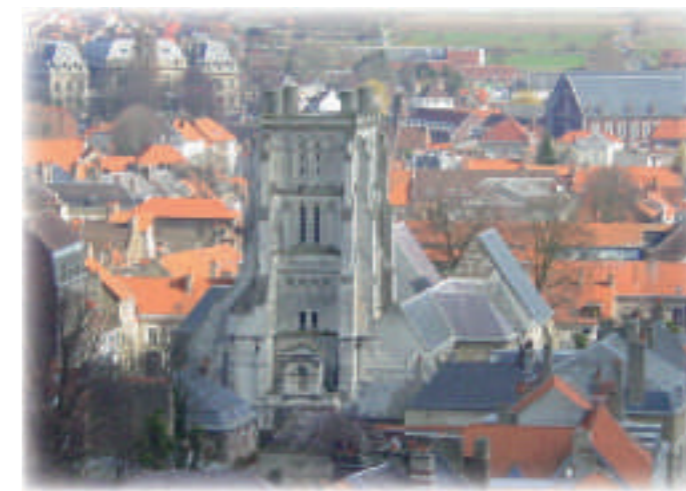
Vue aérienne Saint-Denis

Le samedi : à 14h, 15h, 16h et 17h Le dimanche : à 10h et 11h puis à 14h, 15h, 16h et 17h Tarif : 3 €/pers.