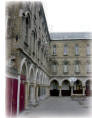
Le lycée Saint-Denis

Le lycée technique privé Saint-Denis, devenu professionnel en 1955 occupe le bâtiment de l'ancien couvent des Carmes. Le 7 décembre 1859, une communauté de six Pères Carmes et de deux Frères s'installe à Saint-Omer. Elle fait édifier le cloître et la chapelle, de style