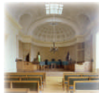
Le palais de justice

Accueil par l'Association des Amis de Saint-Omer