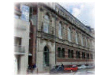
La façade de la bibliothèque

La bibliothèque de l'Agglomération de Saint-Omer a été aménagée dans les bâtiments de l'ancien collège des Jésuites Wallons. La salle du patrimoine regroupe 2000 manuscrits et 238 incunables dont un exemplaire de la célèbre Bible à 42 lignes de Gutenberg.