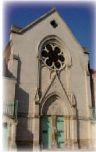
La façade de la chapelle

Cette exposition retrace l'histoire de l'ancien Couvent « Le Bon Pasteur » devenu depuis 1968 « Centre d'Observation et de Traitement Anne Frank », mais aussi son évolution et son insertion dans le quartier à travers des photos, des croquis, des témoignages et des vidéos. Un moment riche en émotion pour tous ceux qui souhaitent découvrir la vie de ces jeunes filles recueillies.