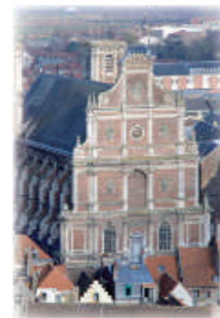
La chapelle des Jésuites