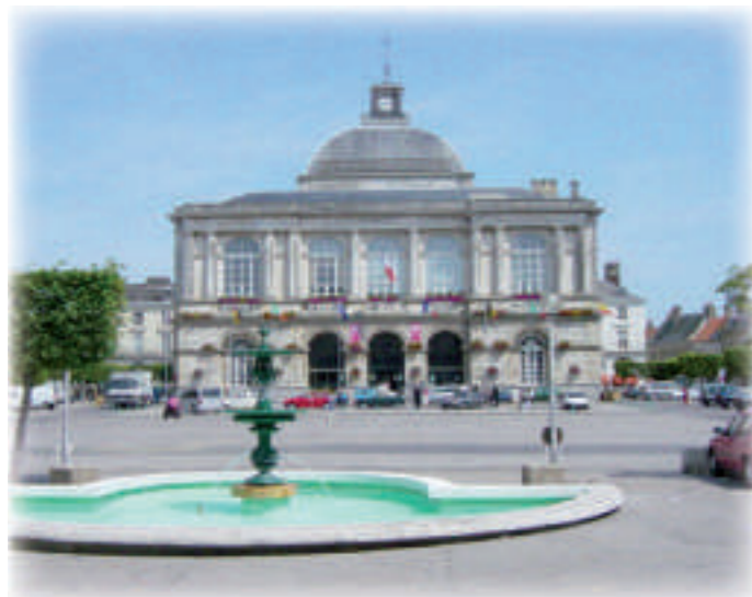
L'hôtel de ville

Place du Maréchal Foch Accueil par l'Association des Amis des Musées de Saint-Omer