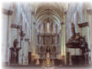
La nef de la cathédrale

Accueil par l'Association « Les Amis de la Cathédrale » Après la destruction de Théroanne par Charles Quint, la collégiale devient cathédrale en 1561. Elle est l'unique cathédrale gothique du Nord-Pas-de-Calais et abrite un tableau du célèbre peintre Rubens représentant la Descente de Croix.